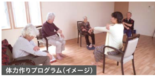
体力作りプログラム(イメージ)

ソルシアス上用賀のサービスコンセプトは「Wellness&Culture」。専任講師によるヨガレッスン、マッサージ、ストレッチや、高齢者体力づくり支援士監修による体操プログラムなどにご参加いただける「Wellness」。そして各分野の専任講師によるフラワーアレンジメント、フィットセラピー、お菓子教室、メイクレッスン、ネイルなどをお楽しみいただける「Culture」をご提供しております。