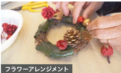
フラワーアレンジメント