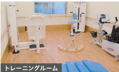
トレーニングルーム