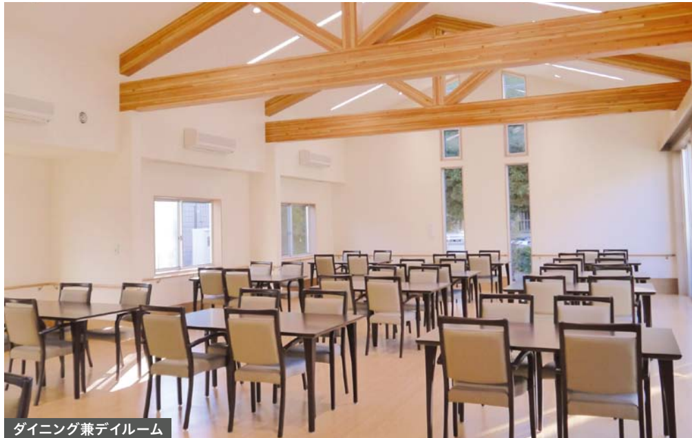
ダイニング兼デイルーム